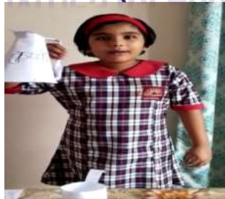
SWARNIKA II A चीजों को नापने के विविध साधन