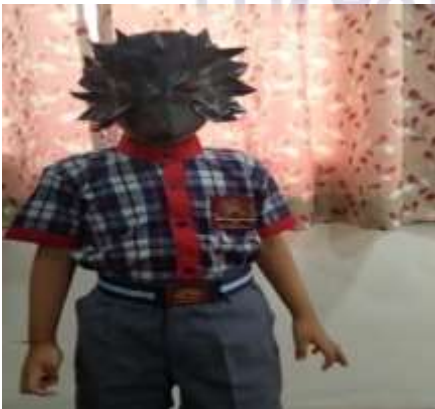
ABHINESH I C DRAMATIZATION OF STORY THIRSTY CROW