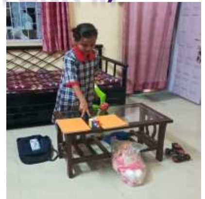
ARADHYA II B PREPOSITIONS ON, UNDER ETC.