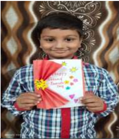
PRUDVI (III C)