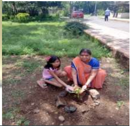
ANANTA (IV C)