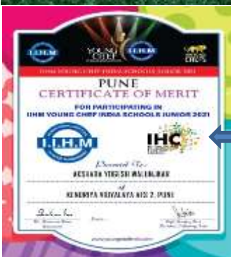
AKSHARA (V A) PARTICIPATED IN IIHM PUNE YOUNG CHEF COMPETITION