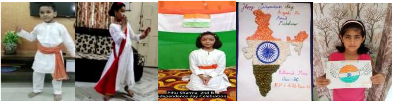
ADITYA I A