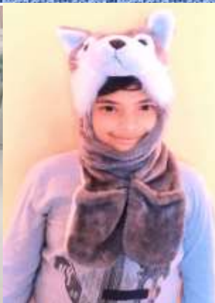
NAADAV (IV A)