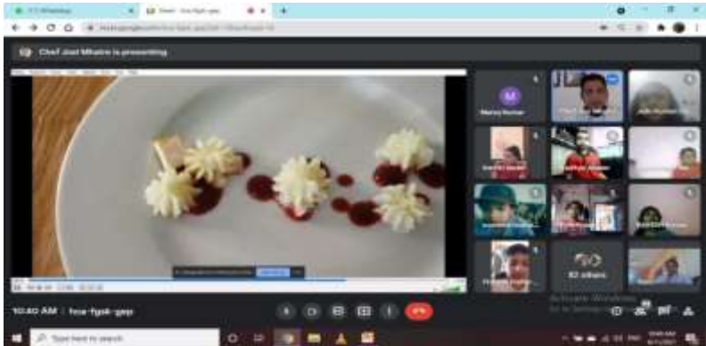
SHRI JOEL MHTRE, FACULTY, IIHM PUNE SESSION ON PLATE PRESENTATION