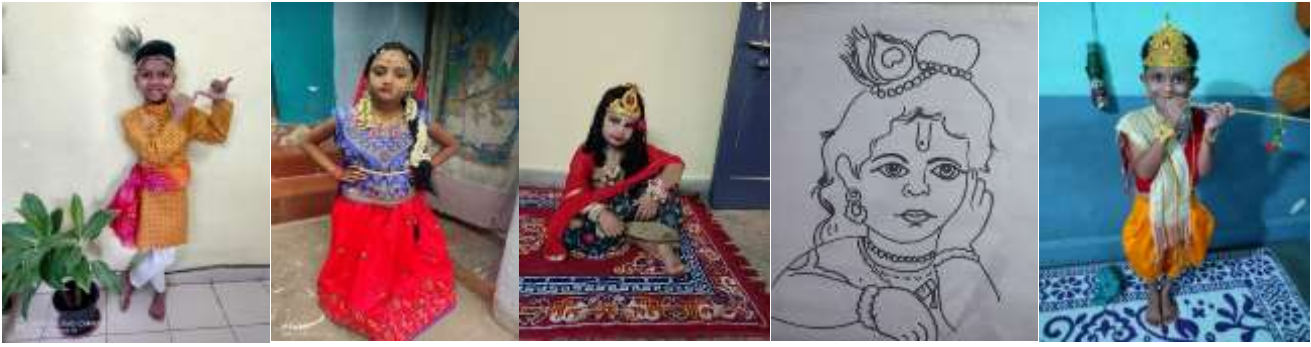
AARUSH III A