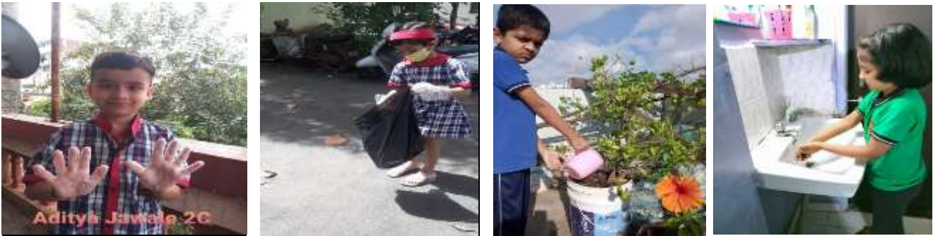
ADITYA II C