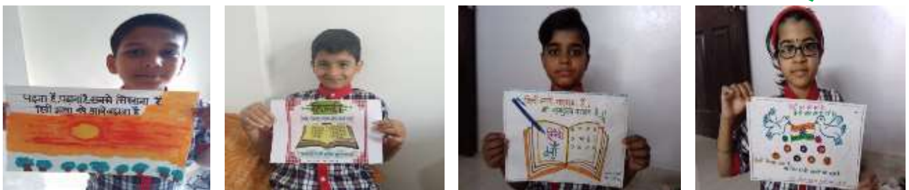
AZAVAZHAGAN II C